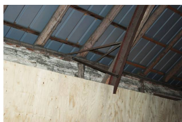
Den øverste del af indervæggen er konstrueret, så den er selv bærende.

Ved den øgede lagringshøjde og en mindre forlængelse af planlagret, er der nu plads til 800 tons korn og frø, som en del af den samlede høst på "Henriksholm".