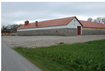
"Henriksholm" i kanten af Romdrup