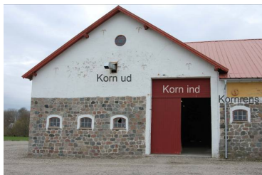
Teksterne på gavlen findes ikke i virkeligheden, men alene som guide til beskrivelsen

Når kornet skal renses, bliver affaldet ført ud gennem et rør i tremplens til en container.