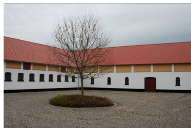
Gårdspladsen på "Henriksholm"