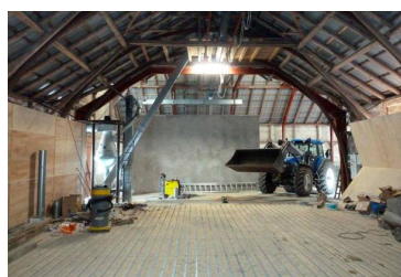
Den nye plansilo med kørefast trægulv og perforerede riste for tørring og beluftning.

En ny bund af træplanker med stålriste imellem blev udlagt ovenpå det gamle betongulv, hvorefter indervæggen og en hovedkanal af træ blev opbygget.