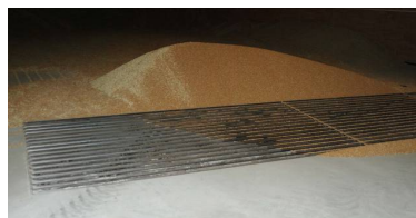
Påslag med underliggende korngrav