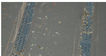
Detalje af trægulvet med beluftningsriste

Ved ombygning af bevaringsværdige bygninger som denne har det en stor betydning, hvordan moderne teknik indbygges, så det ikke spolerer helhedsindtrykket af det samlede gårdanlæg.