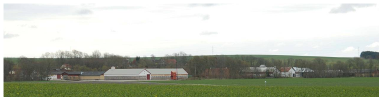
På dette foto er der manipuleret med farven på pandepladetaget for at vise, hvordan det galvaniserede kunne komme til at matche de øvrige gårdes tagflader i Romdrup som et alternativ.

"Henriksholm" er en firelænget bevaringsværdig gårdejendom med et stuehus fra 1900 og tre avls- og driftsbygninger fra 1928 og har tidligere hørt under Lindenborg Gods.