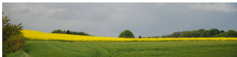
Næste kornhøst venter forude

Det er vigtigt, at logistikken er superoptimeret, lige fra kornet og frøet transporteres ind fra høsten på marken, rensningen, tørringen og lagringen til afgrøderne ligger på lastvognen, som bringer afgrøderne til videre anvendelse.