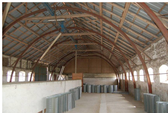
Den oprindelige kostald med valsede rundbuer af stål

Vestlængen var oprindeligt en kostald med hvælvvingeloft hvor hø- og halm blev opbevaret ovenpå. I 1950 blev hvælvvingeloftet fjernet, og længens stabilitet blev bibeholdt med rundbuer af stål. Rundbuene blev tildannet på stedet ved koldvalsning af I-profiler, som blev forankret i fundamenter og stabiliserede ydermurene med skråbånd og tagkonstruktionen med bl.a. langsgående træåse, som taget hviler af på.