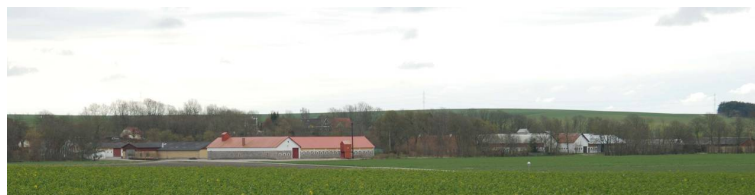
"Henriksholm" ligger, som de andre gårde, helt ind mod den markante bakkeø / holm